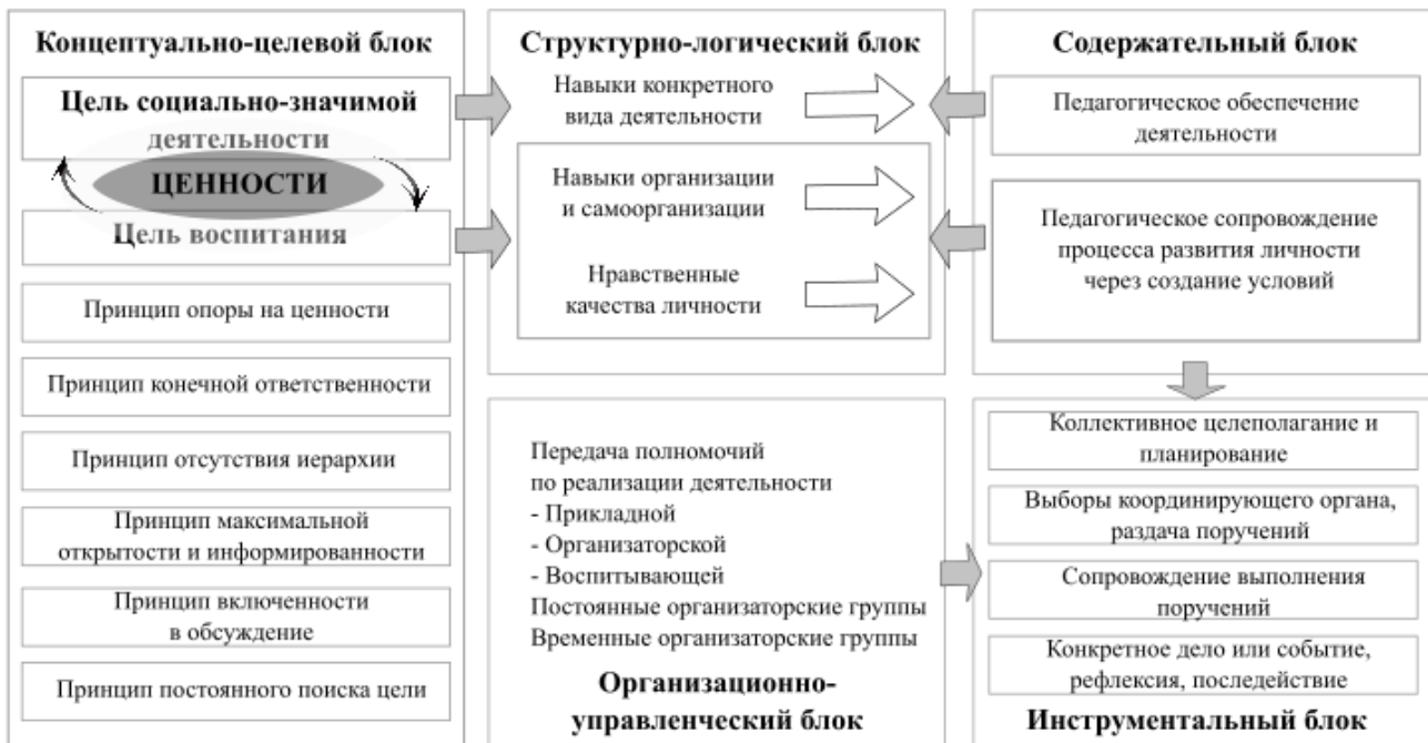
Рисунок 1. Модель социально-значимой деятельности подростков в детском сообществе

В схематическом виде модель может быть представлена следующим образом (рисунок 1):